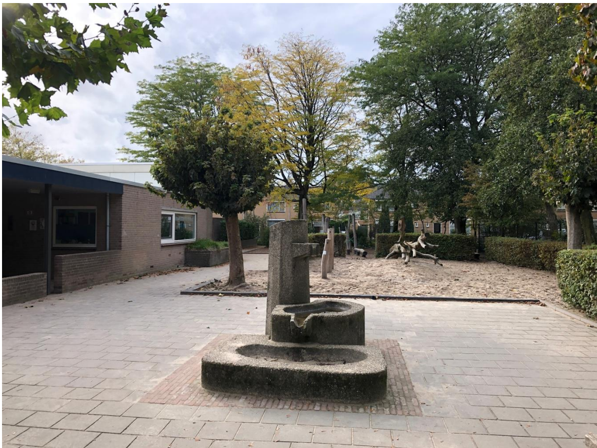
RK Basisschool Pieter Wijten