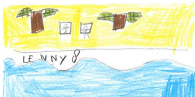
Lenny (gr 8)

Dinsdag 22 september hebben de leerkrachten en studiedag. Alle kinderen zijn dan vrij!!! Vergeet u dit niet te regelen met de voor- en naschoolse opvang.