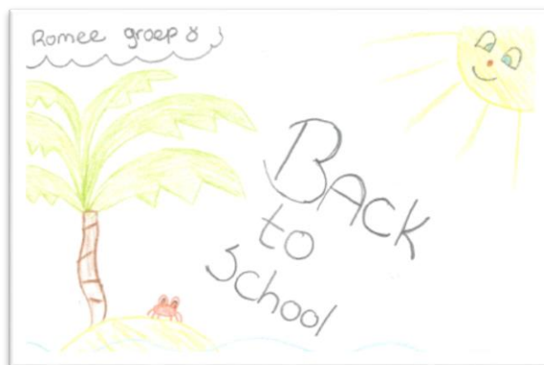
Romee (gr 8)