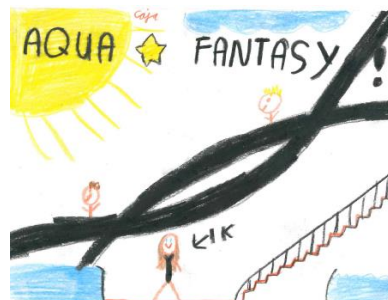
Caja (gr 8)

Antwoord: Als u uw kind vóór 10.00 uur op de dag afmeldt, hoeft u niet te betalen. Meld u niet of te laat af, dan wordt deze dag wel in rekening gebracht.