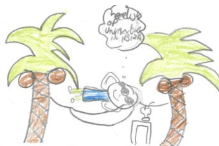
Nik (gr 8)