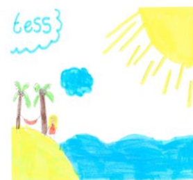
Tess (gr 8)

Antwoord: Nee, het aan- en afmelden van TSO gaat per kind. Elk kind dient dus afzonderlijk aan- of afgemeld te worden.