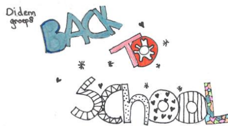
Didem (gr 8)