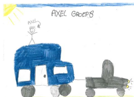
Axel (gr 8)