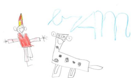
Bram (gr 3)