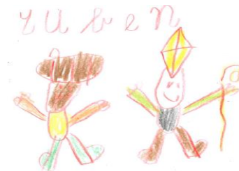
Ruben (gr 3)

Bent u niet in de gelegenheid om op deze avond te kunnen komen met uw kind, geef dan 's morgens de schoen al mee.