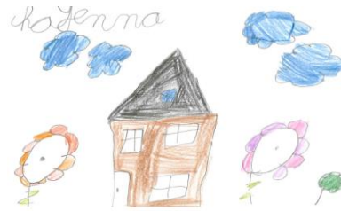
Chayenna (gr 3)