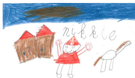
Nikkie (gr 3)