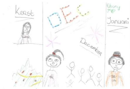
Ebony (gr 8)