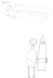
Liam ( gr 2)

De luizencontroles gaan vanaf het nieuwe schooljaar s morgens plaats vinden ipv s middags.