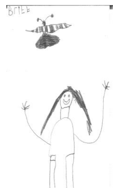
Britt ( gr 1)