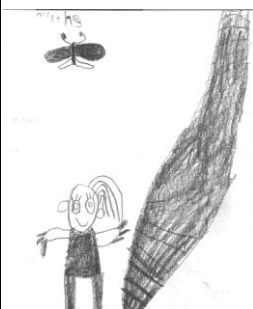
Mirthe ( gr 2)