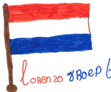
Lorenzo ( gr 6)