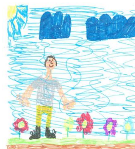
Tristan ( gr 7)