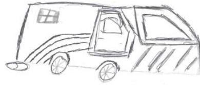
Ryan ( gr 6)