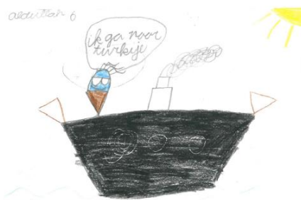
Abdullah ( gr 6)